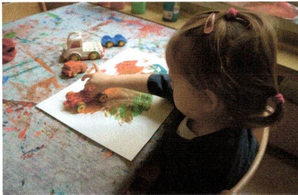
Likovno ustvarjanje z najmlajšimi.