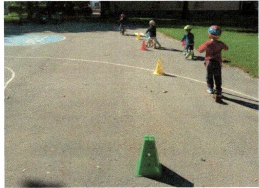
S skiroji in kolesi med ovirami.