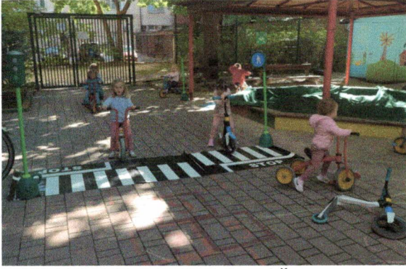
Prometni poligon v enoti Sneguljčica.