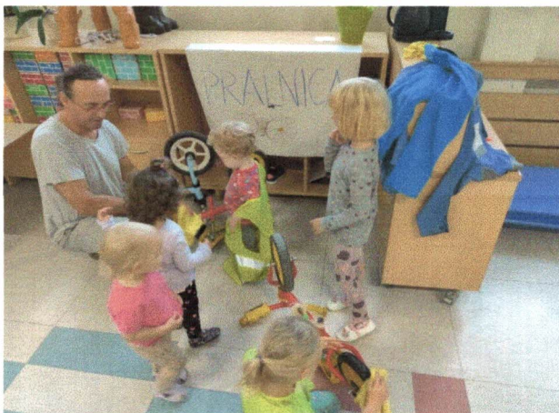
Pralnica koles v enoti Storžek.